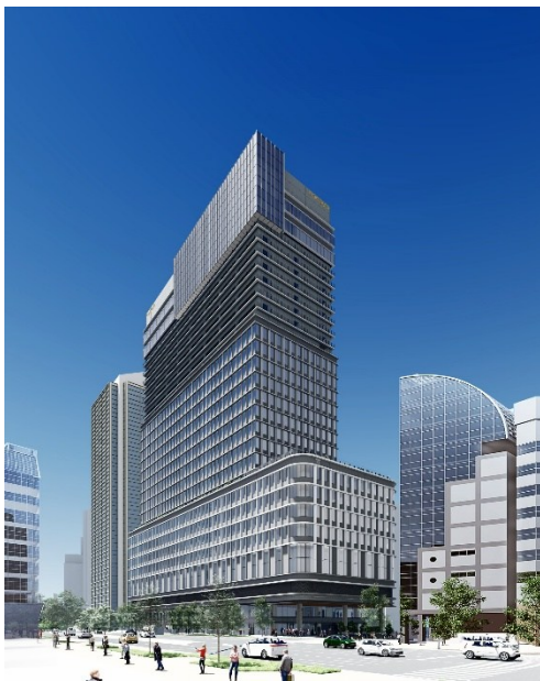
※北東からの外観イメージ