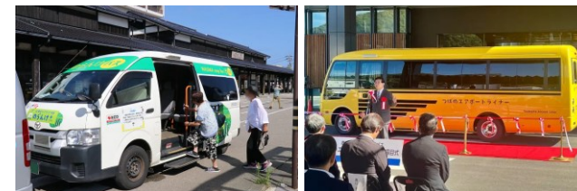
▲各地の取組例 左：被災地へのデマンド交通導入（石川県輪島市） 右：交通結節点からの「観光の足」確保（熊本県人吉市～鹿児島県霧島市）