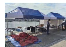
待合用テント(税関・待合対応) (ターミナルなし港湾)