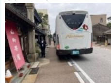
二次交通機能の強化