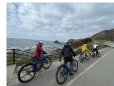
港で滞在できる空間整備