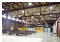
CIQスペースの確保 (ターミナルあり港湾)