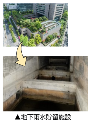
▲地下雨水貯留施設