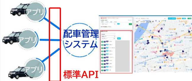
標準APIによりタクシーやデマンドバスの配車アプリ-配車管理Sysを統合・一元化

タクシー配車管理システムやデマンドバス配車システムなど多様化するシステムの連携・統合による業務効率向上を推進するため、標準APIの導入を支援