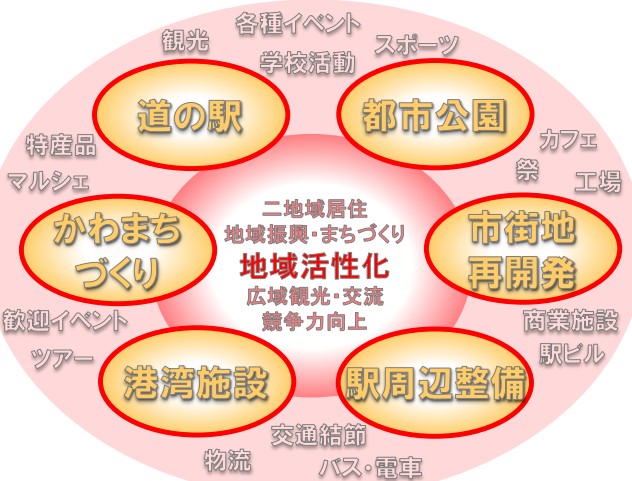
— イメージ —