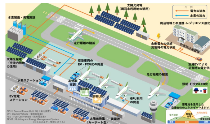
空港の脱炭素化推進のイメージ