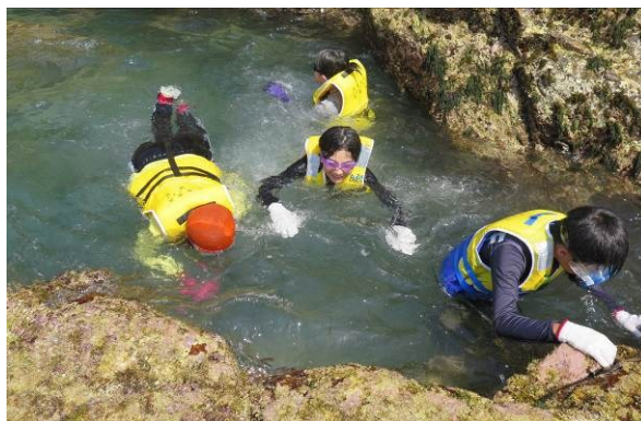
鹿島の海で海洋体験（甌島：鹿児島県薩摩川内市）

※国土交通省では、離島振興に資する取組として、離島活性化交付金等を通じて離島留学に係る受入体制の充実等、自治体の取組を支援しています。