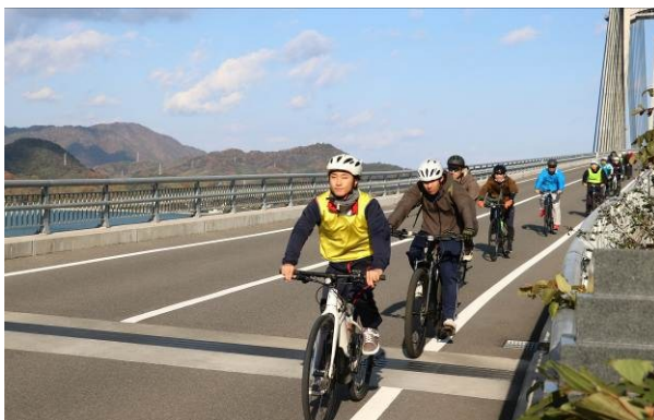
サイクリングガイドをする様子（弓削島：愛媛県上島町）