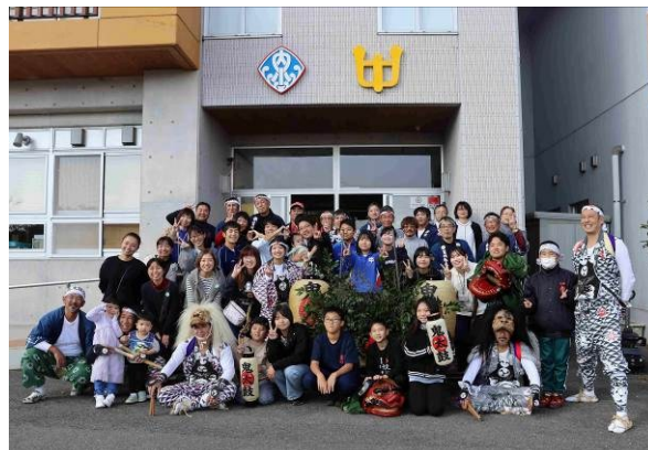
鬼太鼓集合写真（佐渡島：新潟県佐渡市）