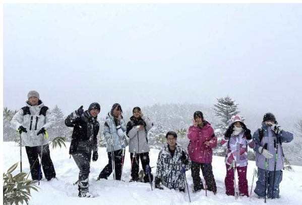
地域交流事業での環境学習（礼文島：北海道礼文町）