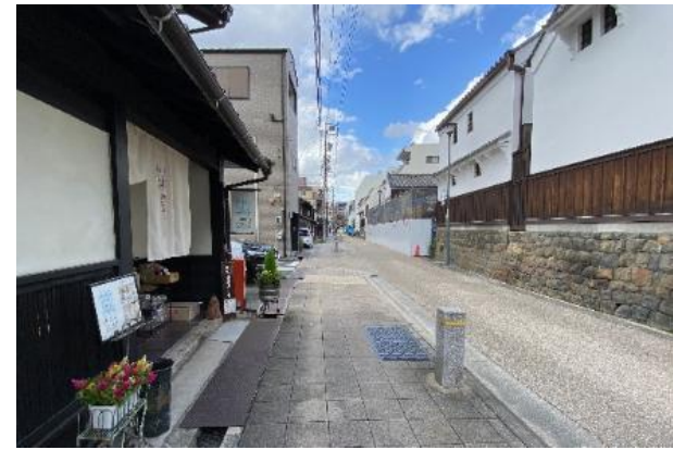
エリアリノベーションにより景観が再生された事例 (名古屋市西区那古野)