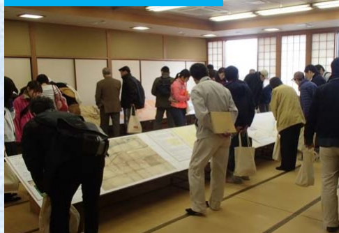
絵図を熱心に見る来館の皆さん