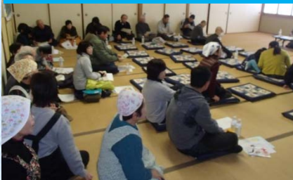
〈平島地区自主防災組織による防災訓練の様子〉