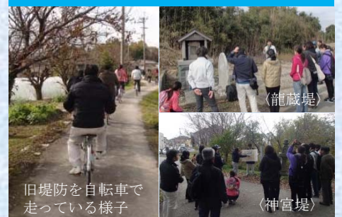
旧堤防を自転車で走っている様子