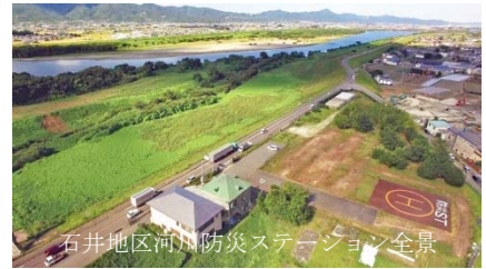
石井地区河川防災ステーション全景