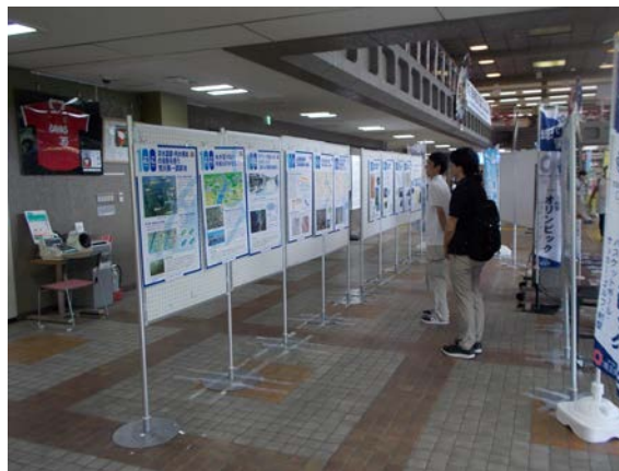
戸田市(7/10～7/27:市役所本庁舎2階ロビー)