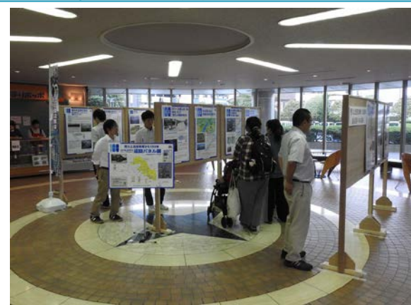
川口市(9/12～9/26:鳩ヶ谷庁舎1階エントランス)