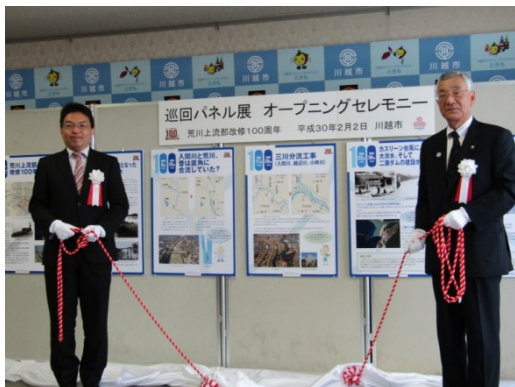
除幕式(左:古市事務所長、右:川合川越市長)