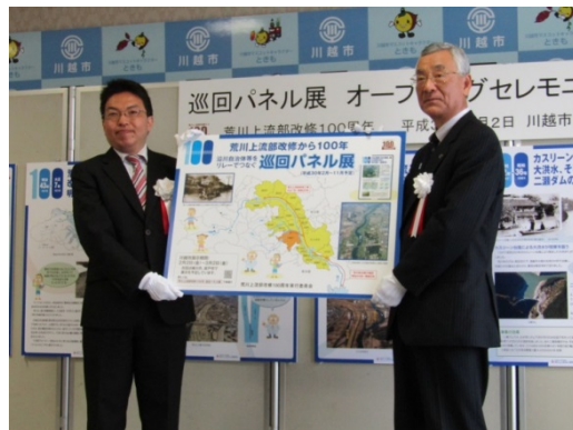
オープニングボード受け渡し式