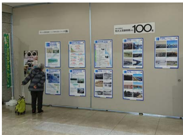
坂戸市(4/2～4/6):坂戸市役所市民ホール