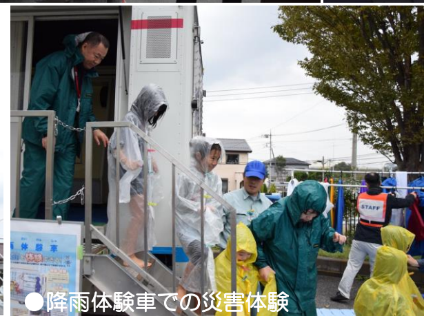
●降雨体験車での災害体験