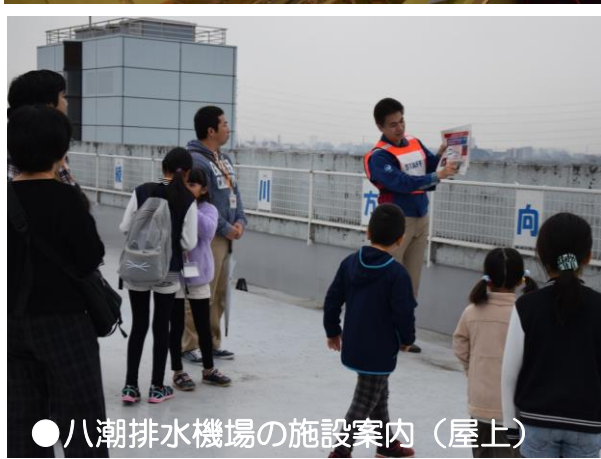
●八潮排水機場の施設案内(屋上)