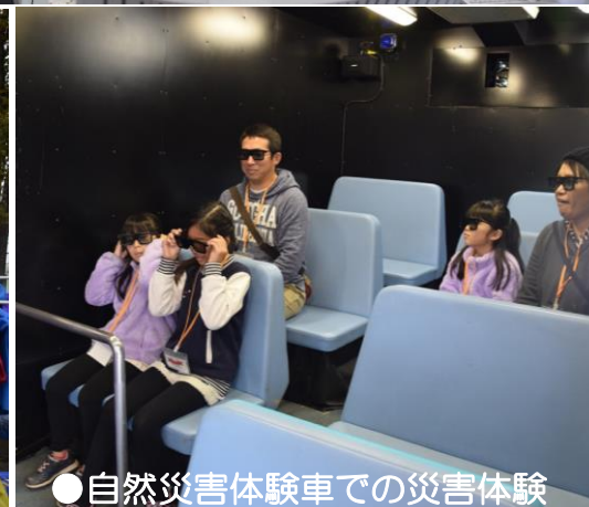
●自然災害体験車での災害体験

国土交通省では、完成から一定期間経過した治水施設について、地域の方々と、その生き立ちを振り返り、果たしてきた役割や地域の水害・土砂災害リスクについて再認識していただく、「アニバーサリープロジェクト」を推進しています。