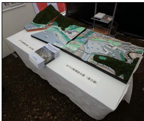
模型を用いた事業説明