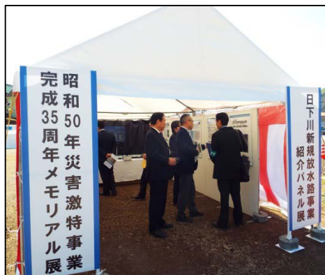
展示ブースの状況

日下川新規放水路起工式会場において、日高村主催の起工式関連イベントが開催され約500名の方が来場されました。高知河川国道事務所は、日下川新規放水路の事業紹介パネルを出展するとともに、直轄河川激甚災害対策特別緊急事業の経緯や効果について紹介した動画の上映や事業紹介パネルの説明を行い、多くの参加者に興味をもって見ていただけました。また、事務所や出張所の掲示板に事業紹介パネルを設置し、来所された方々に興味をもって見ていただきました。