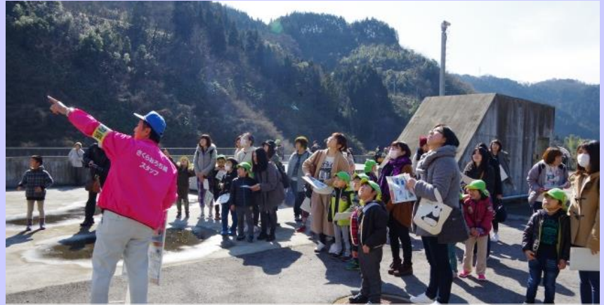
放流前に、地元の親子たちが尾原ダムの役割や点検の目的を学びました。