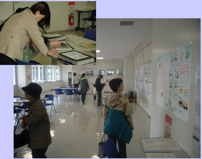
尾原ダム管理支所ロビーにおいても、パネルや資料等でダム事業をPR