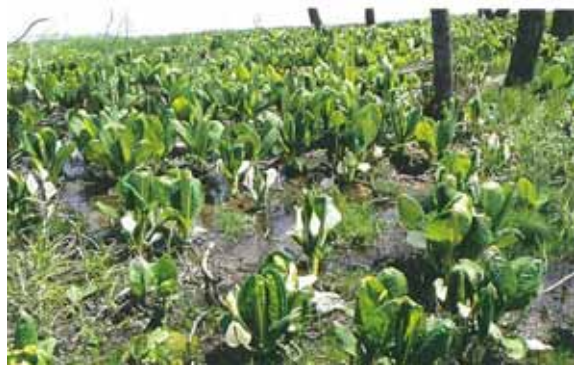
女満別湿性植物群落（ミズバショウ）