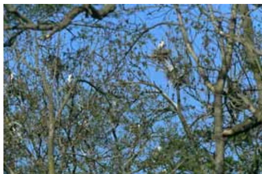
アオサギコロニー