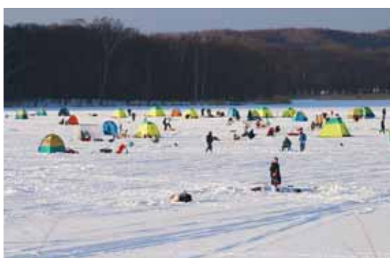
網走湖のワカサギ釣り