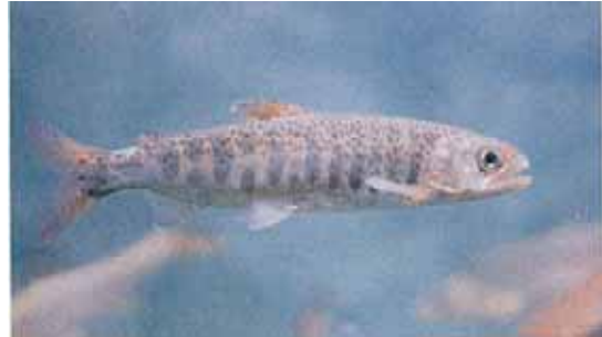
サクラマス（ヤマメ）