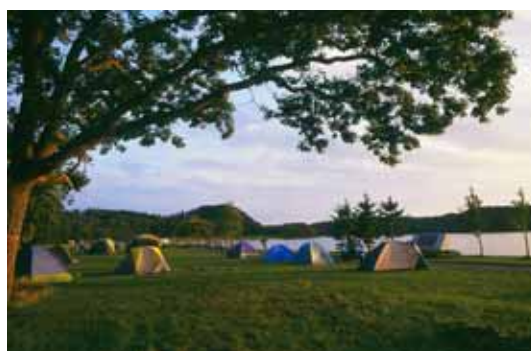
網走湖畔キャンプ場