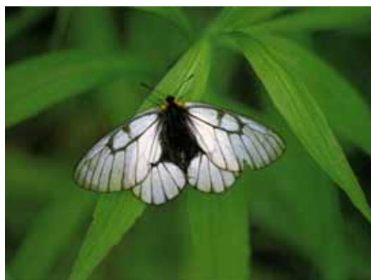
ヒメウスバシロチョウ

網走川流域は北東部地域にあって夏季の冷涼、冬季の酷寒という気象条件下にあるが、自然植生地がまだ比較的広く残されていることから、ヒメウスバシロチョウ、エゾチツゼミ等の北海道特産種、準北海道特産種、キタイトトンボ、ゴトウアカイトトンボ、エゾリンゴシジミ等の北海道を分布の南限とする種の多くの昆虫が生息している。