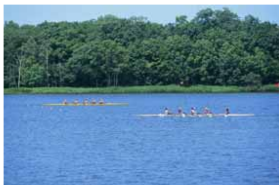
網走湖での漕艇競技