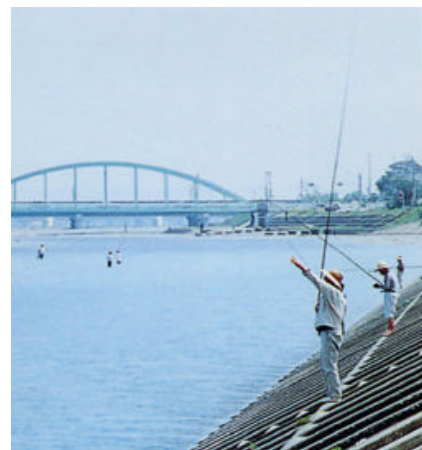
アユ釣り (安倍川4.0k付近右岸) 安倍川、藁科川では、市街地周辺で身近にアユ釣りが楽しめる。