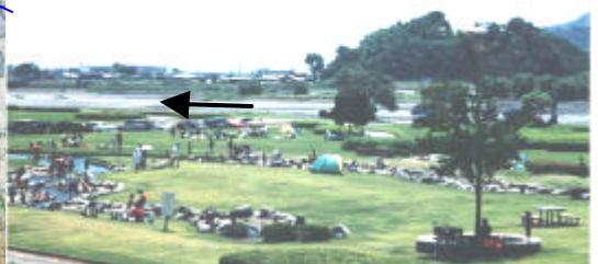
親水公園 (安倍川5.0k付近左岸) 高水敷上の親水公園は、流域内の人々が川と親しみ、憩いの場となっている。

震災時には、東西に走る鉄道や道路を南北に結ぶ緊急用道路として、人員や救援物資を円滑に運搬する。また、平常時には、地域住民の方がジョギングや散歩、サイクリング等で川に親しみのもてる空間を提供している。