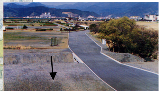
緊急用河川敷道路 (安倍川6.5k付近左岸)

震災時には、東西に走る鉄道や道路を南北に結ぶ緊急用道路として、人員や救援物資を円滑に運搬する。また、平常時には、地域住民の方がジョギングや散歩、サイクリング等で川に親しみのもてる空間を提供している。