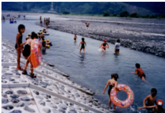
水遊び (安倍川17.0k付近左岸) 水辺に近づきやすく水遊びの風景が見られる。