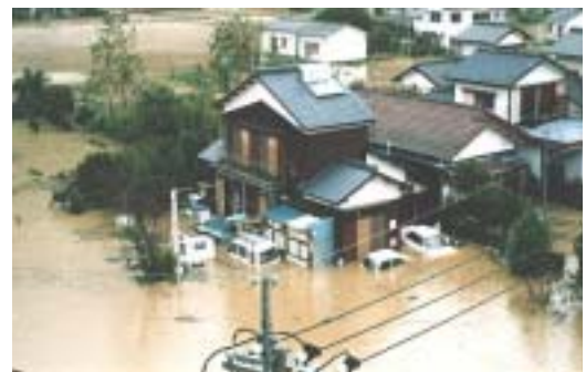
浸水した佐伯市内

台風 19 号は 14 日に奄美大島近海に達し、その後も強い勢力を保ち種子島の西海上を北上し 16 日 8 時過ぎに鹿児島県枕崎市 まくらぎ 付近に上陸した。上陸後はやや勢力を弱め、熊本県、大分県を通過し瀬戸内海へ抜けた。台風の影響により、14 日から降り始めた雨は徐々に強くなり、16 日の 13 時から 14 時までの 1 時間に本川上流の因尾観測所で 44mm、支川井崎川の宇藤木観測所で 47mm を記録し、15 日から 16 日にかけての 2 日間の雨量は 400mm 超えるものであった。