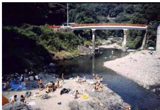
名勝玉川峡（千石橋付近）