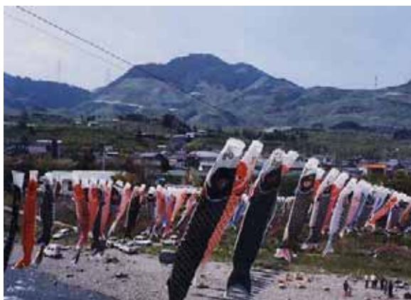
こいのぼりの丹生川渡し