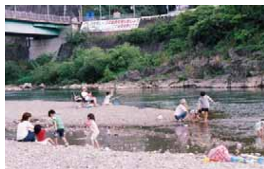
水辺で戯れる子供達