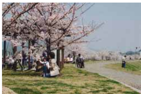
桜を眺めながらの散策