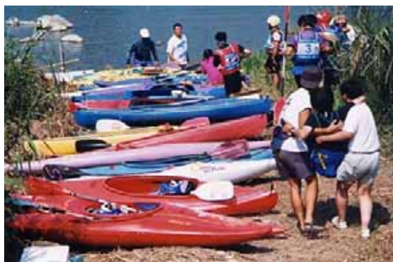
パラマウントチャレンジカヌー

紀の川の水面利用はこのような河川形態を利用した釣り、水遊び等が主となっている。また、紀伊丹生川では、 たまがわきょう 玉川峡として県の名勝に指定（昭和34年4月1日指定）され、和歌山県をはじめ、奈良県、大阪府等周辺地域から豊かな緑につつまれた渓谷の自然美と清流を求め、釣り客やキャンプ客等多数の観光客を集め貴重な観光資源となっている。