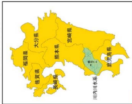
川内川水系位置図