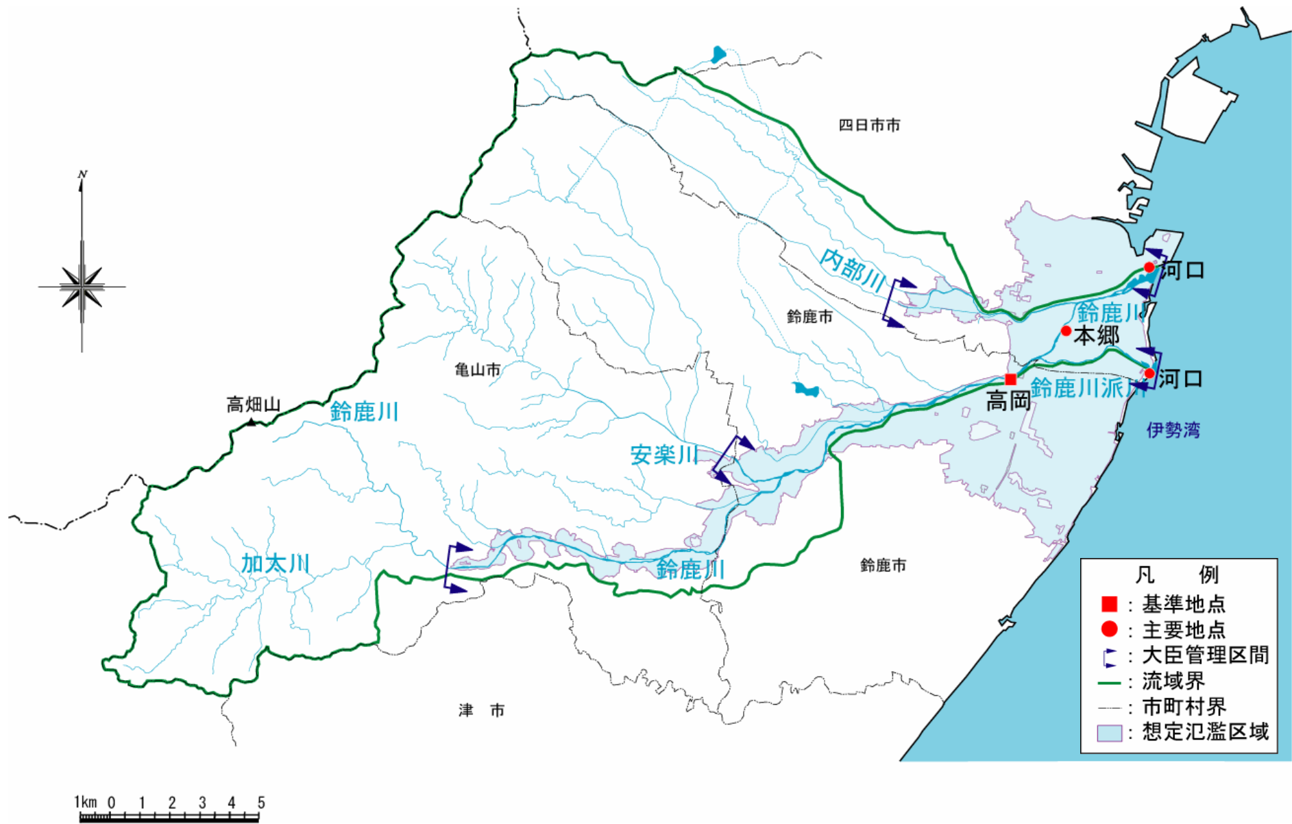
(参考図) 鈴鹿川水系図