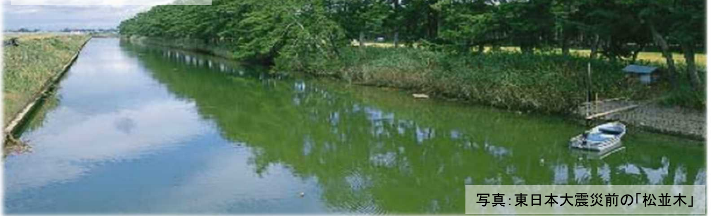
写真：東日本大震災前の「松並木」

古くは舟運を目的に、約400年前仙台藩主伊達政宗の名により建設され、豊かな自然環境を有する土木遺産です