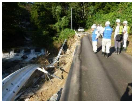
市道荒町風呂ノ入線