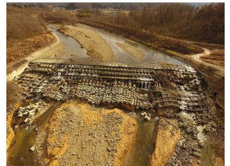
床固工・護床工被災状況