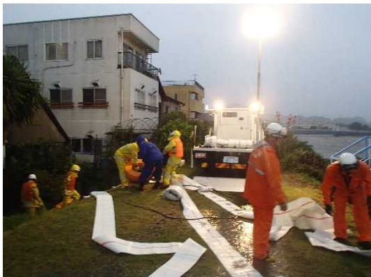
砥部川右岸 (高尾田20番地地先) 排水ポンプ車による排水活動