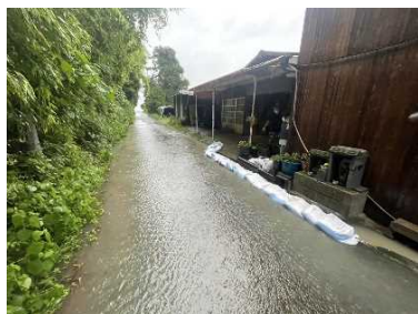
山に隣接した住宅への止水対策 土のう積み②