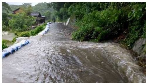
山に隣接した住宅への止水対策 土のう積み①