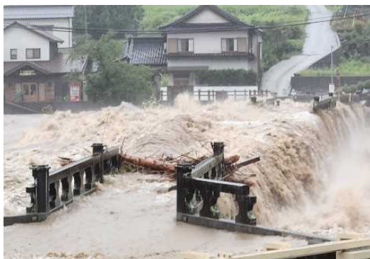
本耶馬溪地区 浸水被害の状況