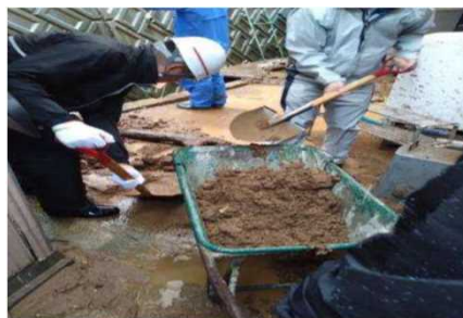
三瓶町津布理 住宅裏での土砂撤去