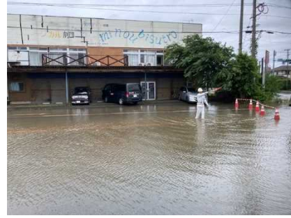
内水氾濫巡視 大刀洗川 (下高橋交差点)