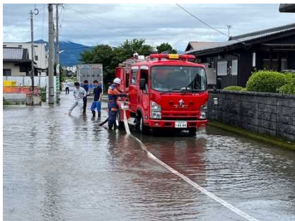
排水作業 山隈地区