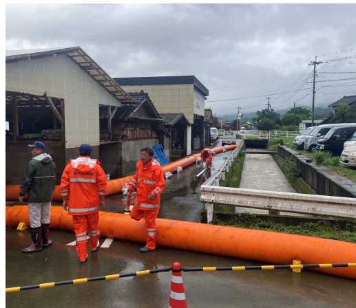
大型水のう設置状況 (永山地区)