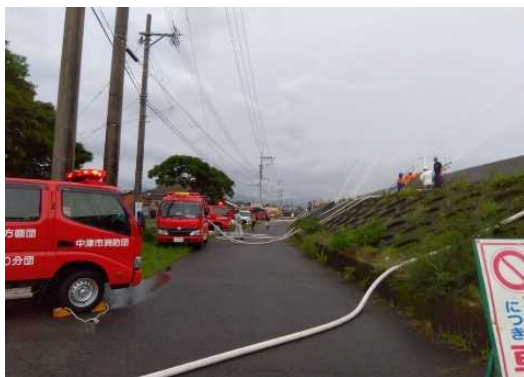
中津川右岸（角木地先） 排水ポンプ車による排水作業