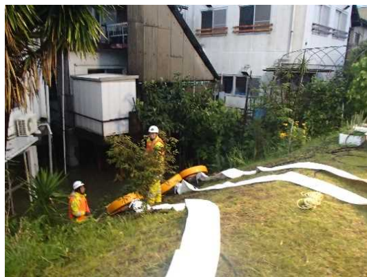
砥部川右岸 (高尾田20番地地先) 排水ホース設置