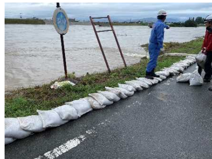
積み土のう工及び排水作業 佐田川左岸 (大刀洗町三川地先)