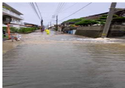
三瓶町朝立地区 浸水被害