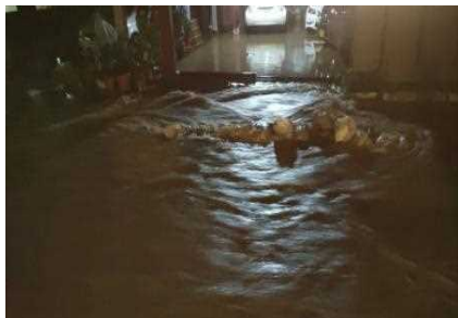
三瓶町周木地区 積み土のう工