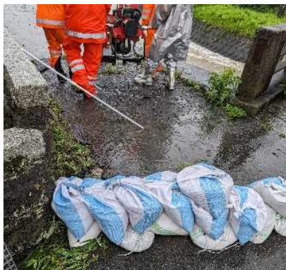
住宅への浸水防止対策 可搬ポンプによる排水作業①