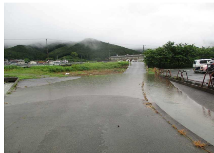
肱川右岸 (宇和町大江) 道路冠水