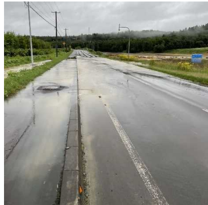
道路状況 (温根別地区)