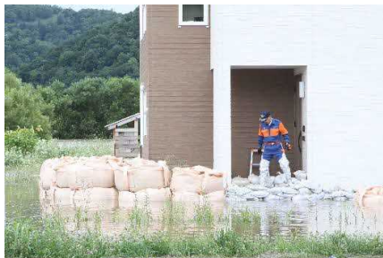
床下浸水被害住家への 積み土のう工