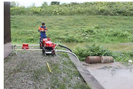
床下浸水被害住家での 小型ポンプによる排水作業