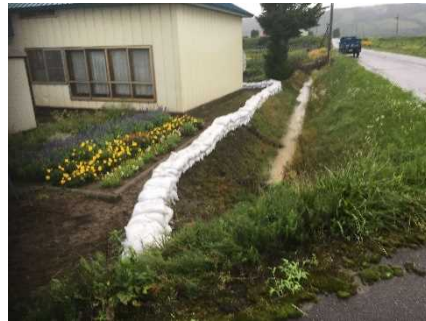
積み土のう工 (多寄町39線西1 (金塚地先))