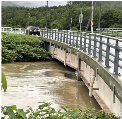
河川状況 (温根別地区)