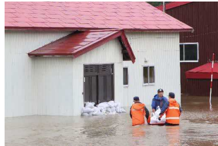
床上浸水被害住家への 積み土のう工