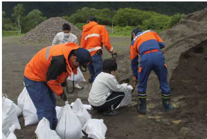
土のう作成の様子