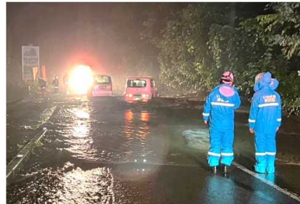
土砂災害警戒 (田人町南大平地内)