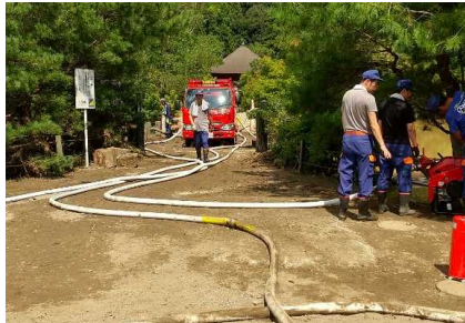
消防ポンプによる排水作業 (内郷白水町地内)