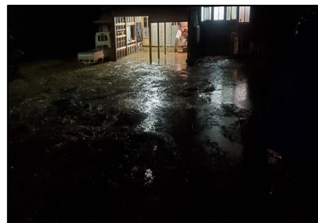
薦川の増水による内水氾濫被害 住民避難