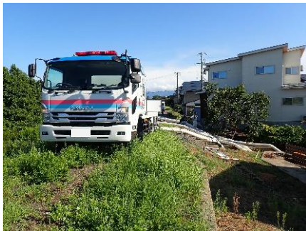
戸野目川左岸（下源入地先） 排水ポンプ車による排水作業