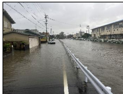
(二) 小石川 溢水被害 (栄町6丁目 地先)