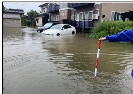
浸水状況 (下源入地内)