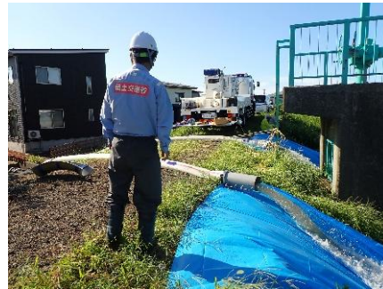
戸野目川左岸（下源入地先） 排水ポンプ車による排水作業