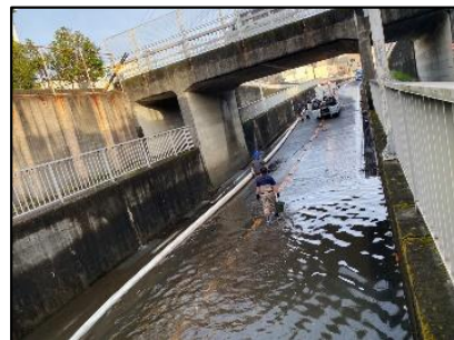
中港地下道 排水作業