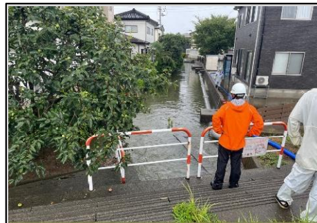
戸野目川右岸 浸水状況 (下源入地内)