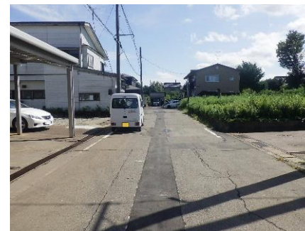
下源入地区 排水作業後