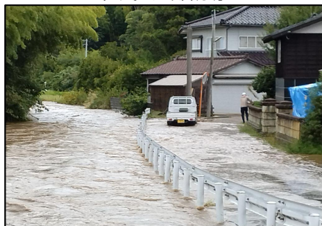
百川の溢水被害 土のう設置作業