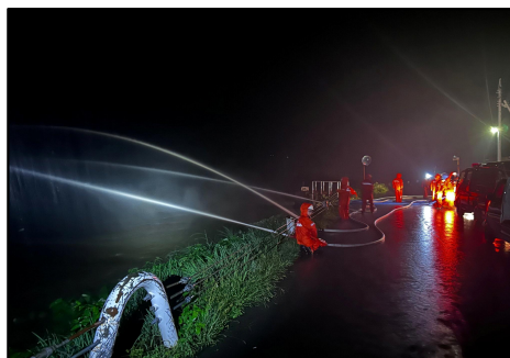
高根川の溢水被害 小型ポンプによる排水作業 住民の避難誘導