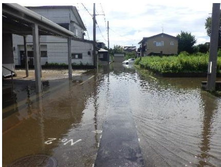
下源入地区 排水作業前