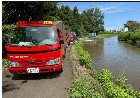
戸野目川右岸（三田新田地内） 可搬ポンプによる排水作業