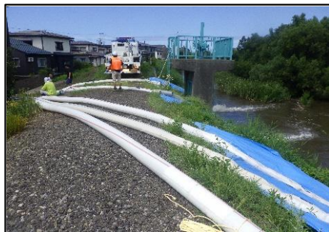
戸野目川右岸（下源入地内） 排水ポンプ車による排水作業