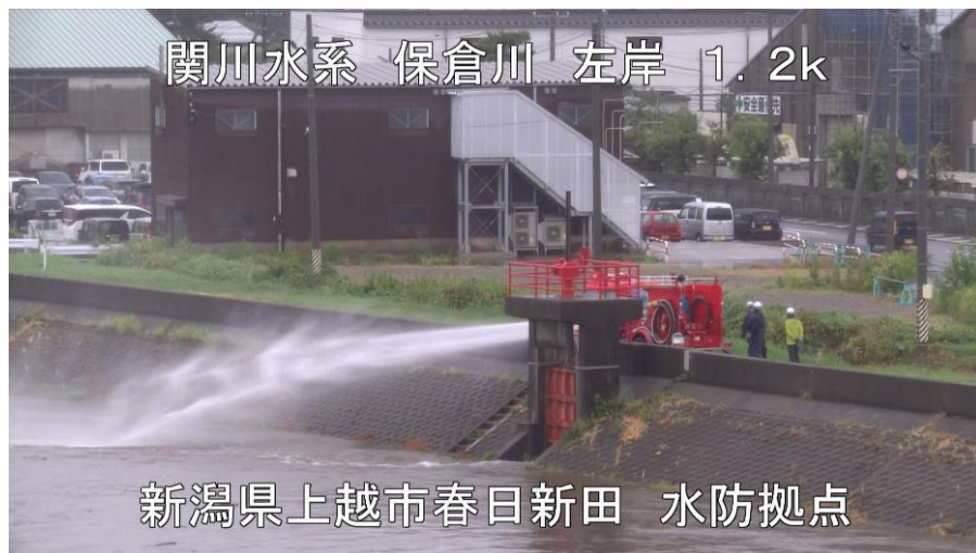
保倉川右岸（港町地先） ポンプ車による排水作業