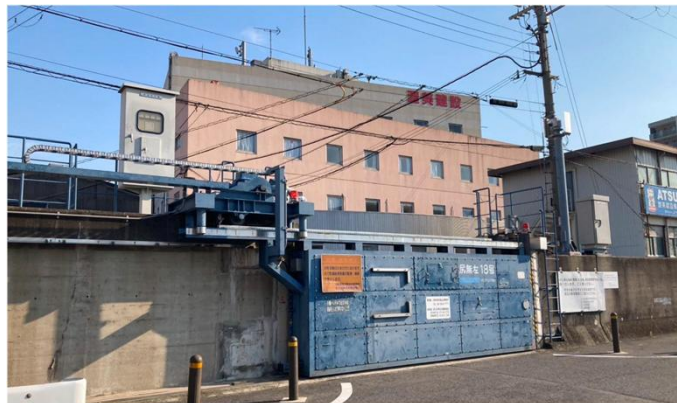
尻無川左岸防潮鉄扉(18号)