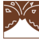
Thảm họa núi lửa