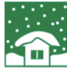
Thiệt hại do tuyết