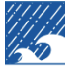
Thiệt hại do bão lũ