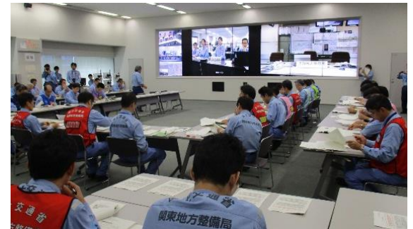
災害対策本部における災害対応 （関東地方整備局）