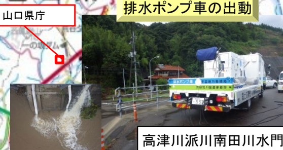
高津川派川南田川水門