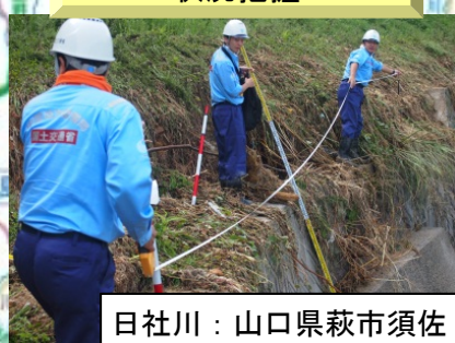
日社川：山口県萩市須佐