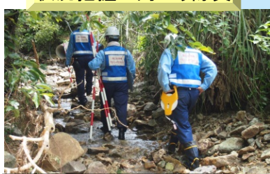
山口県萩市須佐(神田川)