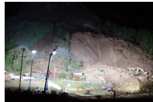
照明車による夜間搜索活動支援