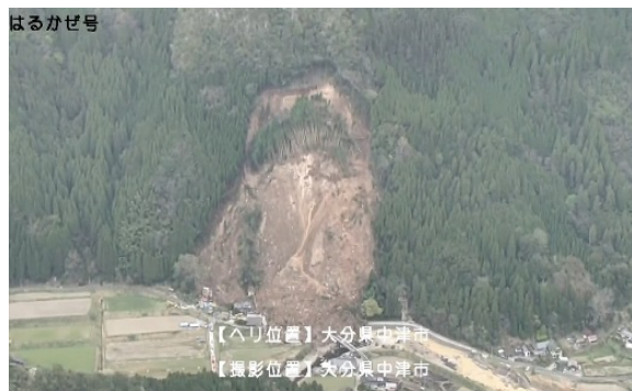
防災ヘリによる被災状況調査