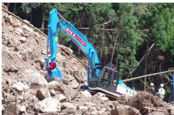
遠隔操作式バックホウによる搜索活動支援