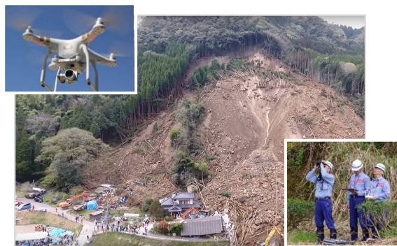
ドローンによる崩落斜面の詳細調査