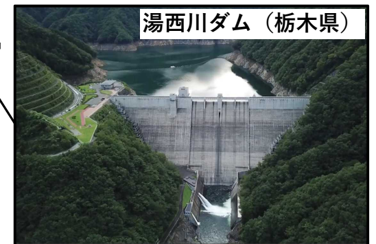
湯西川ダム（栃木県）

発電施設新増設による増電量 ○近年の流況から、 3ダムそれぞれで数百～1千kW程度 の最大出力、 3ダム合計で年間約2千万kWh程度（一般家庭約5千世帯分の年間消費電力に相当） の増電を想定。 ※出力や発電量はダムによって異なります