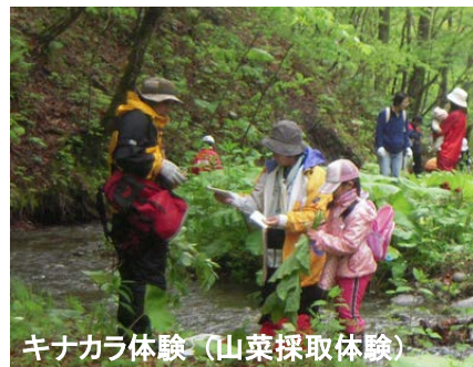
キナカラ体験(山菜採取体験)