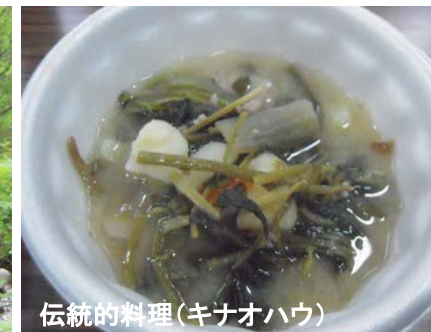
伝統的料理(キナオハウ)