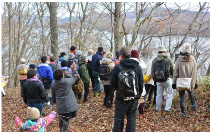
イオルの森の散策