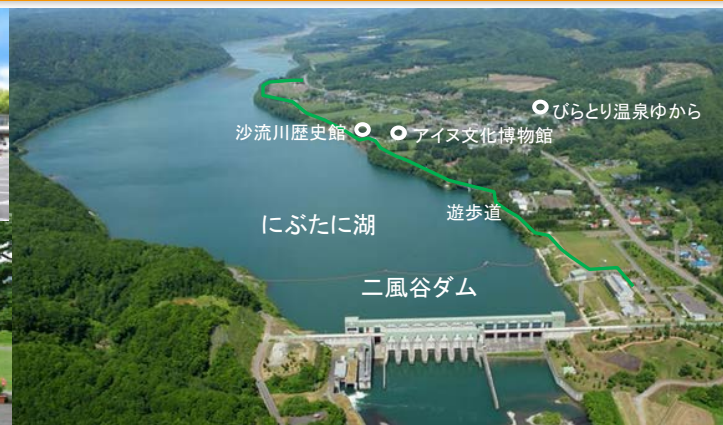
びらとり温泉ゆから 沙流川歴史館 アイヌ文化博物館 遊歩道 にぶたに湖 二風谷ダム