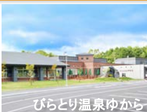
びらとり温泉ゆから