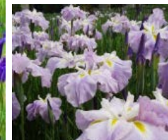
あやめ園(川尻総合公園内)