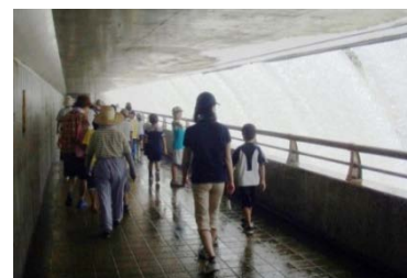
貯砂ダム通廊内散策