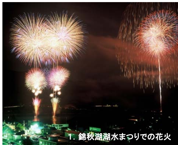
1. 錦秋湖湖水まつりでの花火