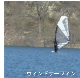
ウインドサーフィン