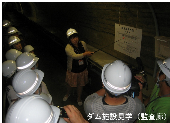
ダム施設見学 (監査廊)