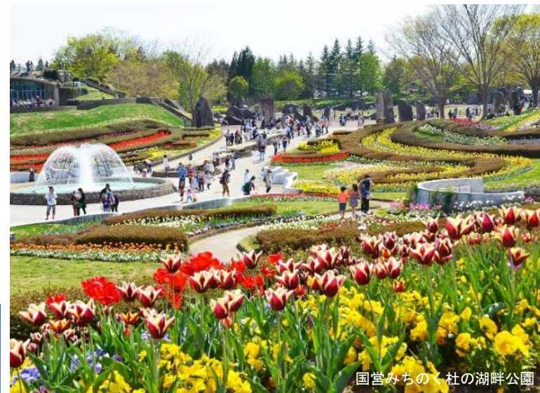
国営みちのく杜の湖畔公園