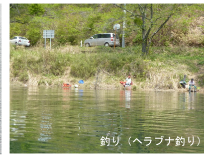
釣り(ヘラブナ釣り)