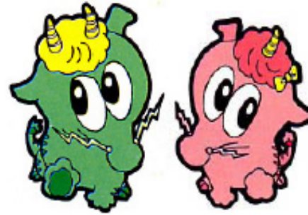
ロンちゃん ルンちゃん

・仙北市に水深日本一の田沢湖があります。この湖に「辰子姫伝説」という昔の言い伝えがあり、その中に龍が登場します。玉川ダム完成前に、旧田沢湖町地域活性のひとつとして、田沢湖国際交流促進協議会と中華民国台湾省自来水公司との間で、田沢湖と澄清湖が姉妹湖に合意されたことから、「辰子姫伝説」と「姉妹湖」から「龍」をモチーフとした玉川ダムのマスコット ロンちゃん・ルンちゃんが誕生しました。