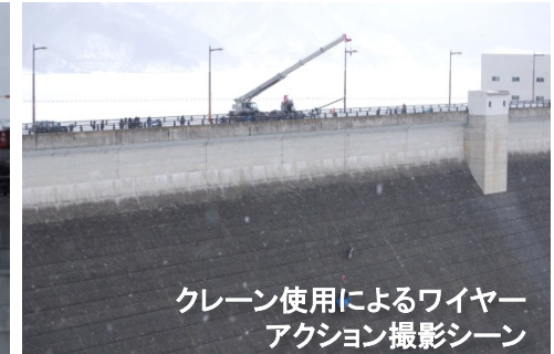
クレーン使用によるワイヤーアクション撮影シーン