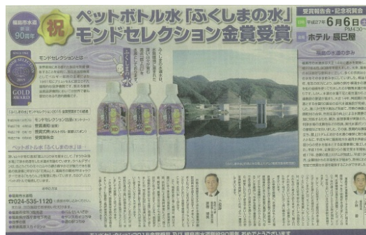
モンドセレクションで金賞