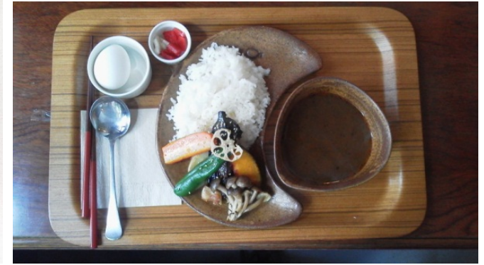
茂庭っ湖スープカレー