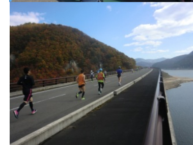
3. 茂庭っ湖マラソン