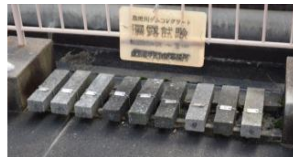
RCDコンクリート 供試体