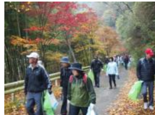
紅葉の高瀬湖クリーンウォーク