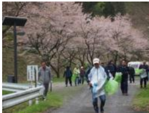
桜の高瀬湖クリーンウォーク

高瀬湖は、山口県周南市高瀬から巢山に位置する島地川ダムのダム湖で、クリーンウォークは、島地川ダム周辺環境整備地区管理協議会の主催で開かれています。この催しは、貯水池周辺の清掃活動を兼ねたウォーキングをする事で、心と体のリフレッシュをする事を目的として、平成15年から毎年2回、桜の時期と紅葉の時期に実施されています。クリーンウォーク修了後は希望者対象でダム見学会を開催しています。