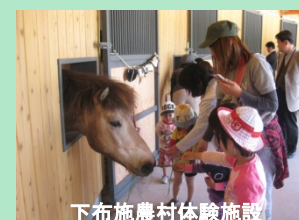
下布施農村体験施設

★お問い合わせ : 尾原ダム管理支所TEL(0854)48-0780 雲南市地域振興課TEL(0854)40-1012 奥出雲町地域振興課TEL(0854)54-2524