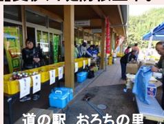
道の駅 おろちの里