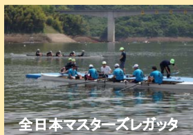
全日本マスターズレガッタ