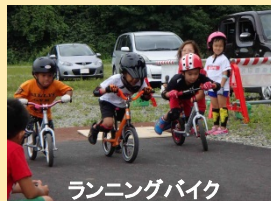
ランニングバイク