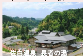
佐白温泉 長者の湯