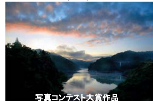
写真コンテスト大賞作品