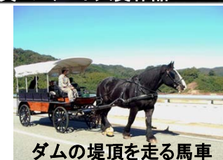
ダムの堤頂を走る馬車