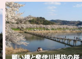
願い橋と斐伊川堤防の桜