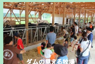
ダムの見える牧場