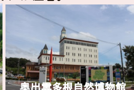
奥出雲多根自然博物館