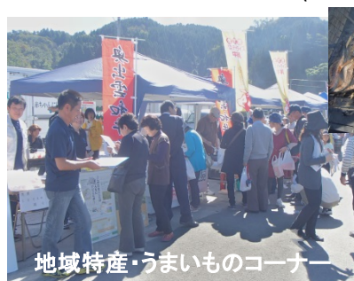
地域特産・うまいものコーナー