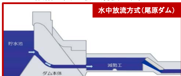
水中放流方式(尾原ダム)