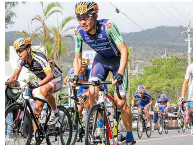
3. ツール・ド・おきなわ大会 湖畔公園一帯を関門所や給水場所に利用