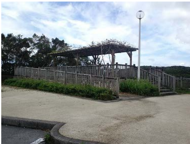
1. 展望台 湖畔公園の展望台