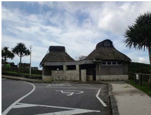
2. 茅ぶき屋根のトイレ 湖畔公園のトイレ