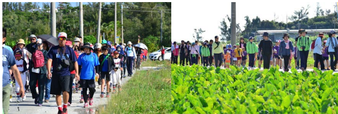
2. ゆいゆいウォーク 環金武湾ウォーキングフェスタ