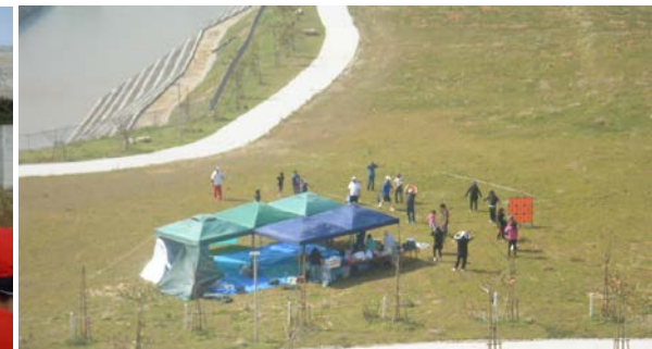
地元住民のデイキャンプ