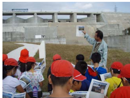
小学生のダム見学