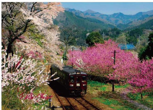
昔なつかしい電車のわたらせ渓谷鐵道