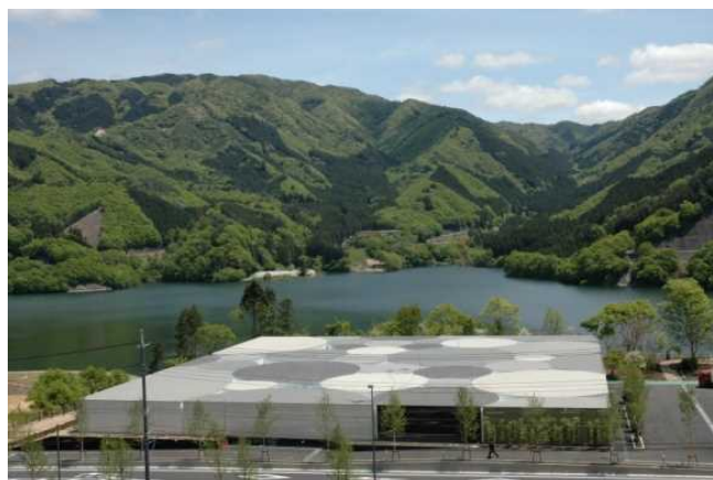
今年25周年を迎えた富弘美術館