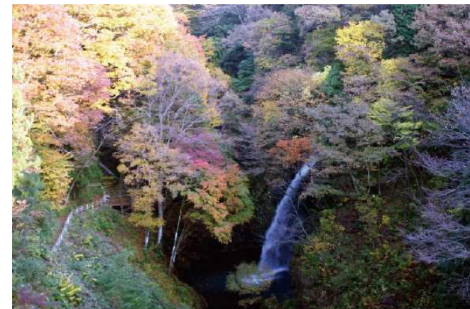
四季色とりどりの不動滝、氷爆も見られます。