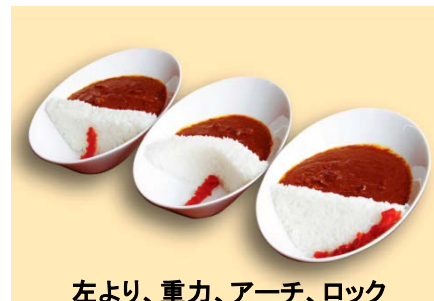
左より、重力、アーチ、ロック

みなかみ町は、利根川の源流であり、型式の違うダムが5つもあり、関東の水がめともよばれています。命の源「水」、そしてみなかみ町の豊かな「自然」に注目していただきたい…。そんな思いで、みなかみ町の飲食店(奈良俣ダムサービスセンターなど8店)が作っています。