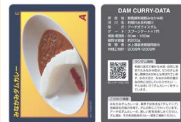
ダムカレーカード