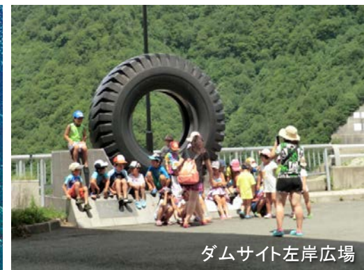
ダムサイト左岸広場