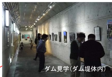
ダム見学(ダム堤体内)

ダム施設と観光施設(スプリングスひよし)を一体的に展開することで、地域を代表する観光地となっています。また、ダム(主に広場)はイベント会場やレクリエーションの場として利用されています。