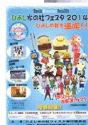
3. ひよし水と杜フェスタ 日吉ダム見学会(ギャラリー内)