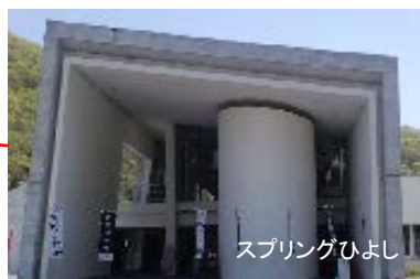
スプリングひよし