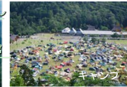
府民の森(土捨て場跡地を活用)