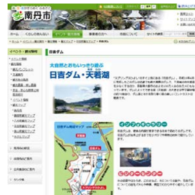
南丹市HP(観光情報)での紹介