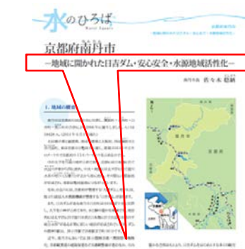
南丹市長から水機構機関誌への寄稿

地域に開かれたダムとして、来訪者がダム施設・観光施設の相互の利用ができるよう整備されています。