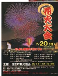
1. ひよし夏祭り ダムゲート室一般開放