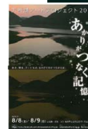
2. 天若湖アートプロジェクト ダム湖面に灯された“あかり”