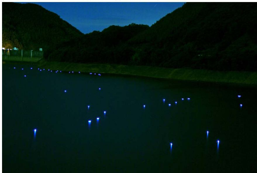
ダム湖周辺では年間約56万人が利用