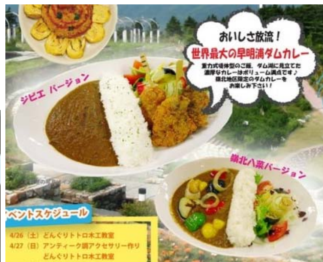
早明浦ダムカレー