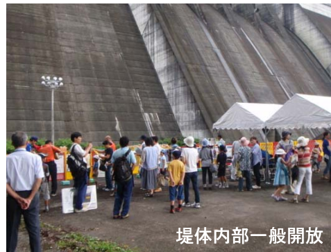
堤体内部一般開放