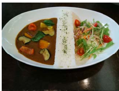
ミニサイズ(嶺北八菜Ver.)