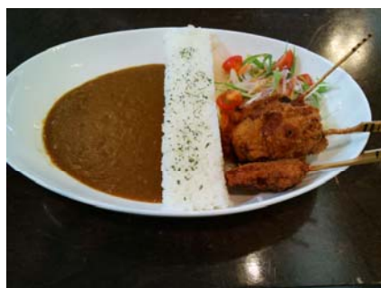
ミニサイズ(ジビエVer.)

大豊町にある「ゆとりすとパークおおとよ」のダムカレー。 通常サイズは幅42センチ、重さ約2kgという、全国にある ダムカレーの中で世界最大サイズだそうです。 (ミニサイズもあります。)