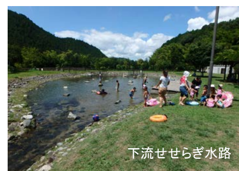
下流せせらぎ水路