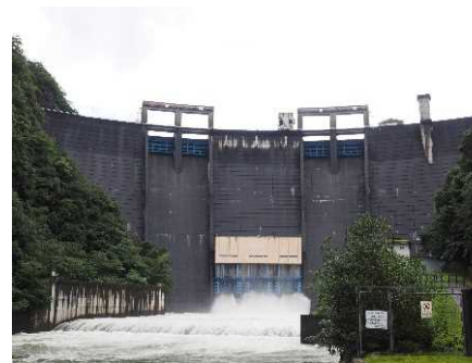
放流中の阿武川ダム (重力式アーチダム)