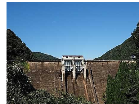
静かな山中にある佐波川ダム (重力式ダム)