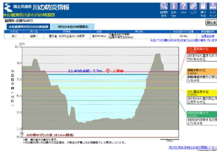
名張川（三重県）名張観測所の実況水位 (10/22 21～22 時 6,919PV)