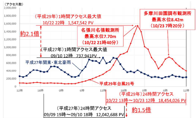
「川の防災情報」アクセス数時系列

※日本列島の広域において洪水が発生したため全体のアクセス増大 ※名張川名張観測所において最高水位到達時に時間アクセス最大