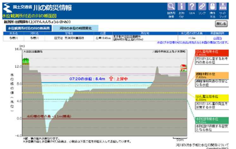
多摩川（東京都）田園調布観測所の実況水位 (10/23 7～8 時 21,395PV)