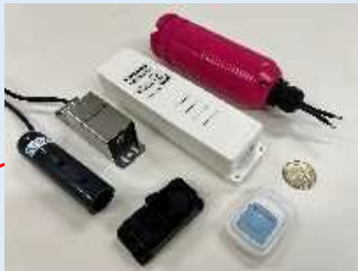
実証実験に用いている6種類の浸水センサ